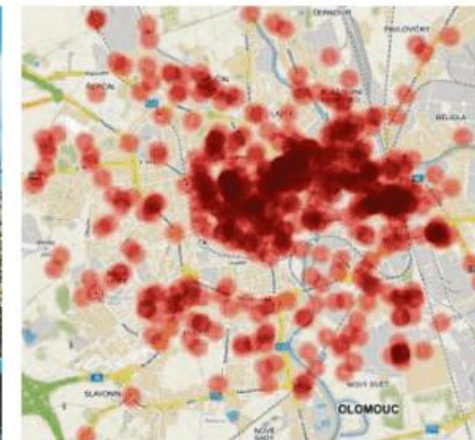
Pocit nebezpečí nemusí v některých lokalitách vůbec odpovídat nahlášené kriminalitě. Typickým příkladem je třeba Ostrava-Přívaz (na snímku), blízko vlakového nádraží. Lidé se tam podle výzkumu bojí, ale policejní statistiky to nepotvrzují. Jak může vypadat počítová mapa nebezpečných míst třeba v Olomouci, ukazuje vizualizace nahoře.

Jenže ke špatné pověsti stačí málo a ta se může táhnout po generace. Podle Ivana je to na případě Ostravy typické třeba pro ulici Dělnická v městské části Ostrava-Poruba. Ostravská tradice vztyčuje u této ulice varovný uka-