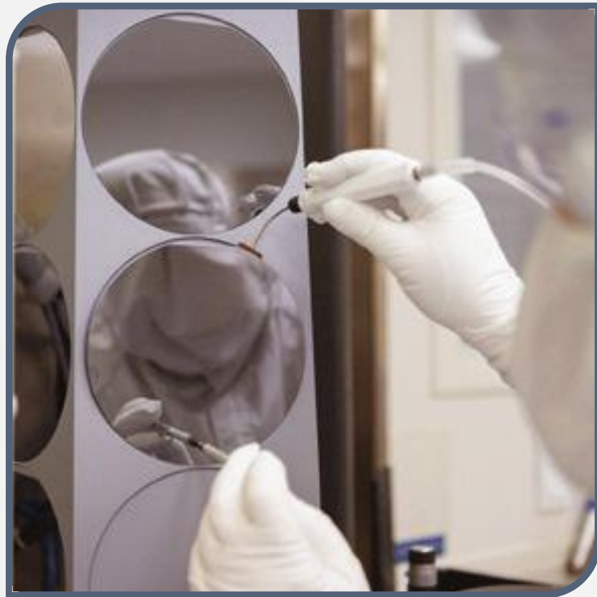
Výroba polovodičových materiálů (SiC a Si)

STAŇ SE SOUČÁSTÍ EXPERTŮ V ROŽNOVĚ P. RADHOŠTĚM NEBO BRNĚ!