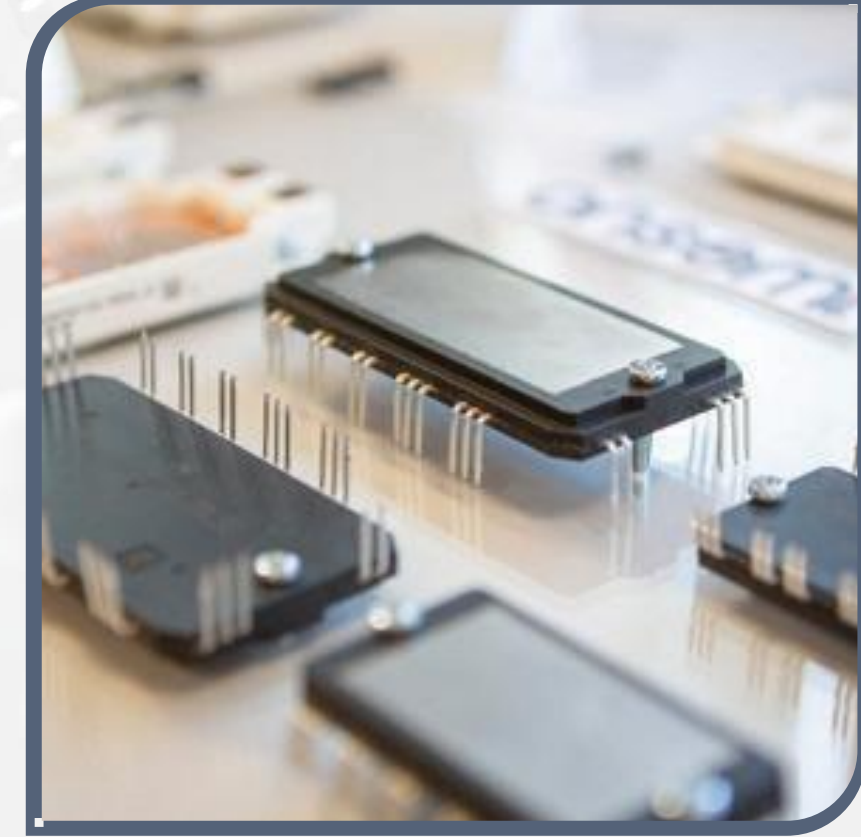
Středisko návrhu součástek